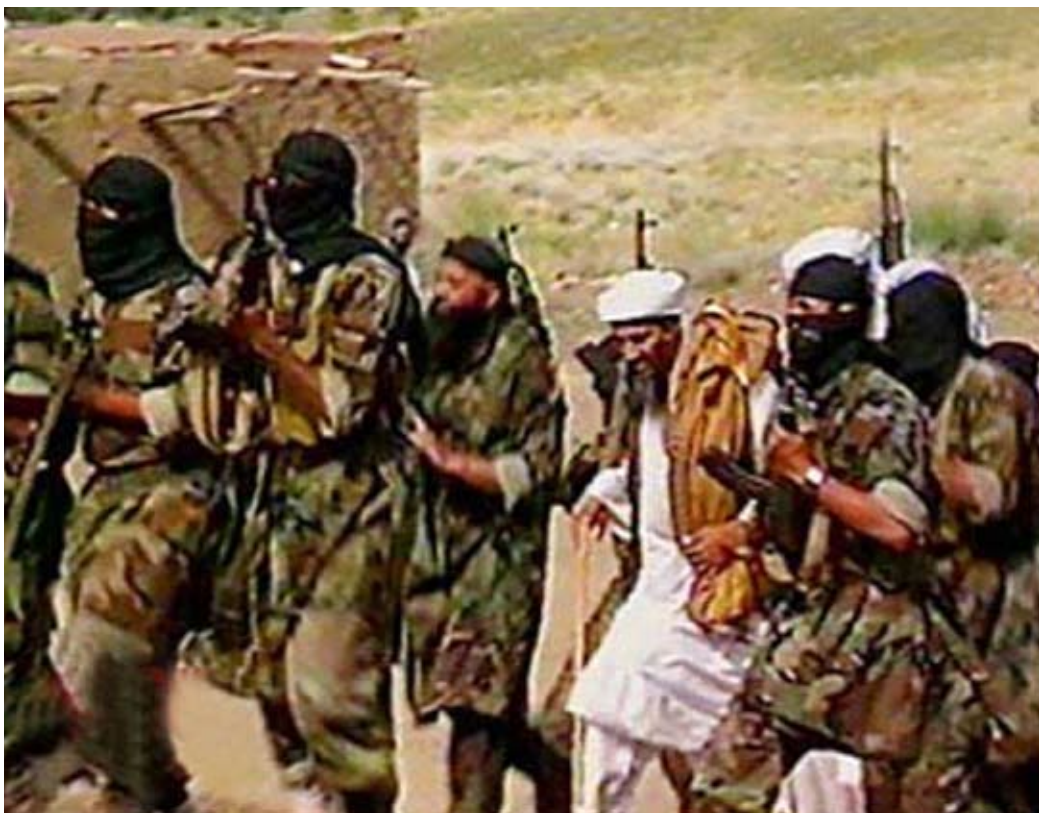
Bin Ladin og hans livvakter

Den vertikale lojaliteten ble skapt på to måter; for det første gjennom den ideologiske indoktrineringen beskrevet ovenfor, og for det andre gjennom Bin Ladins karismatiske lederskap. Al-Qaida var ikke en ren