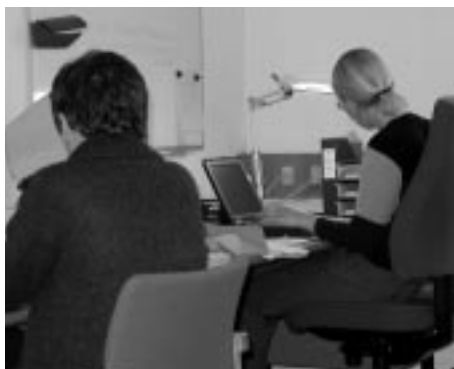
Kodning af aviser kræver koncentration

Det undersøges i den forbindelse om der er forskel på, hvilke forskningsområder henholdsvis avis og TV prioriterer. Er der forskel på den måde, de behandler de forskellige emner? Hvilke kriterier gør sig gældende i de to medier, når forskningshistorier skal udvælges og viderebringes? Disse spørgsmål vil være helt centrale omdrejningspunkter i undersøgelsen. Denne del af projektet vil resultere i en rapport i løbet af foråret år 2000.