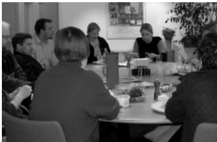
Mobilitetsprojektet diskuteres ved et medarbejdermøde