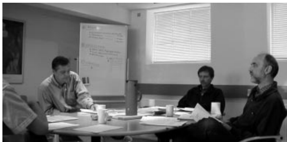
Arbejds møde i projektgruppen

Hvad bestemmer forekomsten og omfanget af virksomhedens FoU-investeringer, Nationaløkonomisk Tidsskrift nr. 1, 1999.